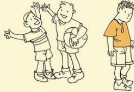
Difficulty in mixing and playing with other children