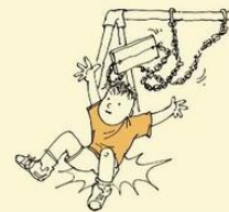
Apparent insensitivity to pain