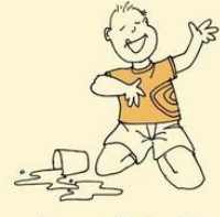
Inappropriate laughing and giggling