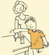
Indicates needs by leading adults by the hand