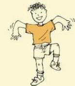
Unusual behaviour or body movement such as flapping hands or rocking and jumping