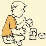
Lack of pretend play or unusual and repetitive pretend play