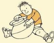
Inappropriate attachment to objects