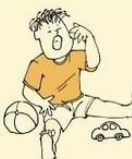
Crying tantrums, extreme distress for no apparent reason