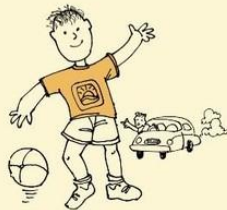
No understanding of fear and real dangers