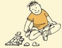
Can do something very well, but not tasks involving social understanding