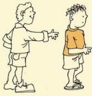
Aloof in manner