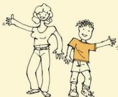
Likes sameness in everyday routine, does not enjoy change