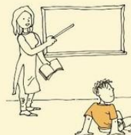
Not responsive to normal teaching methods