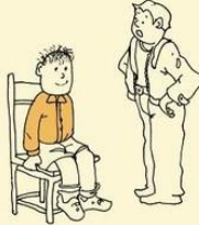
Avoids eye contact