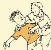
Sometimes doesn't like to be hugged or touched