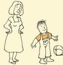
Doesn't respond when called, sometimes appears to be deaf