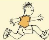
Extreme restlessness, hyperactivity or extreme passivity